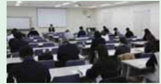
令和7年1月14日：和歌山ビッグ愛