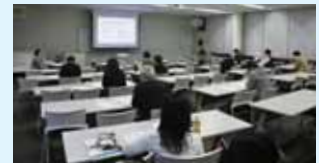
令和7年2月4日：Big・U(田辺市)