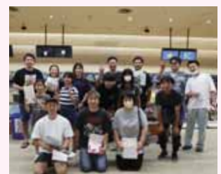
新宮東宝ボウル:7月9日