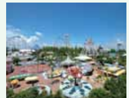
ナガシマスパーランド